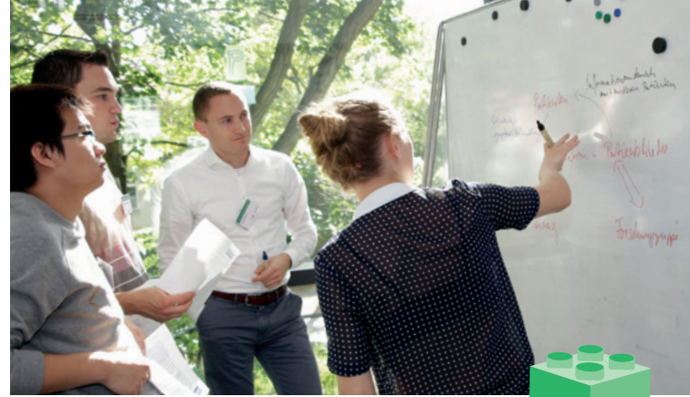
PEEL: Potsdam Entrepreneurship Experience Lab 2014

Tag 2 und 3: Am zweiten und dritten Tag stehen Themenfelder für das Design eines Geschäftsmodells und einer möglichen Unternehmensgründung im Mittelpunkt. Als Tagesabschluss findet jeweils ein Gründungsgespräch statt, in dem erfolgreiche Gründer ihren Weg zur Gründung vorstellen und interessante Einblicke in die unternehmerische Praxis gewähren.