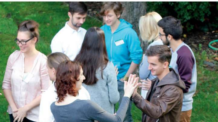
PEEL: Potsdam Entrepreneurship Experience Lab 2014

Die Teilnahme am 4. Potsdam Entrepreneurship Experience Lab ist kostenfrei, wird jedoch auf maximal 30 Teilnehmer begrenzt. Bewerbungsschluss ist der 06. September 2015