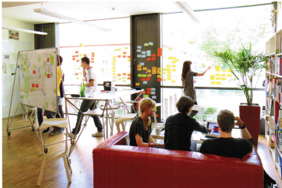
Abbildung 2: Informelle Treffpunkte sind überall auf dem HPI-Campus verteilt.

Studierende nahezu aller Fachrichtungen, die sich in der Schlussphase ihres universitären Master-, Diplom- oder Promotionsstudiums befinden, oder gerade ihren Bachelor abgeschlossen haben, können sich für die studienbegleitende Design Thinking-Ausbildung in Potsdam bewerben, die halbjährlich zu jedem Winter- und Sommersemester beginnt. Gesucht werden vor allem Querdenker, so genannte „T-shaped people“, die bereit sind, die Welt und ihre Mitmenschen aus neuen und unterschiedlichen Blickwinkeln zu betrachten.