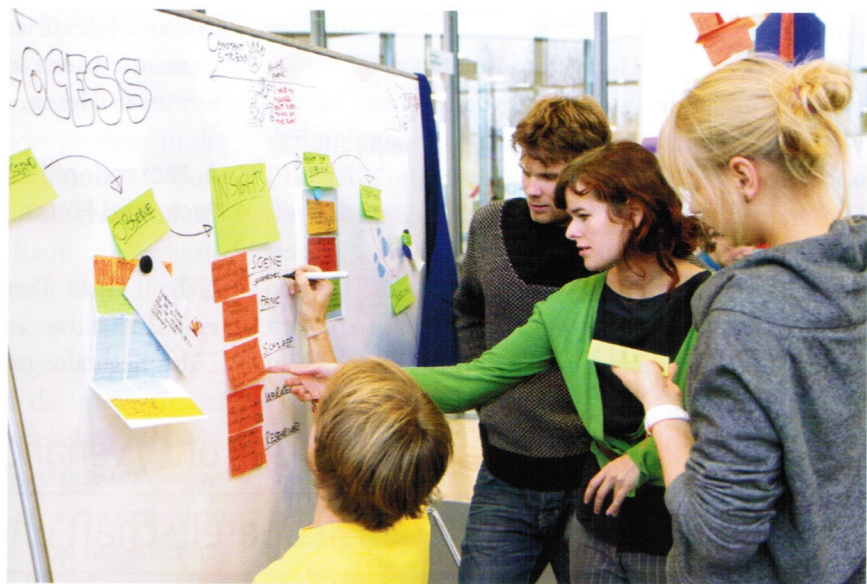
Abbildung 3: Intensiver Austausch mit anderen engagierten Menschen.

In einem Intensiv-Workshop zu Beginn eines jeden Semesters werden die Teacher auf ihre Aufgaben vorbereitet. Ein steter Austausch und methodische Fortbildungen garantieren die hohe Lehrqualität. Mit regelmäßigen Vorträgen zu den verschiedenen Phasen des Design Thinking-Prozesses sowie mit praktischen Tipps tragen die Dozenten aktiv zum Programm bei.